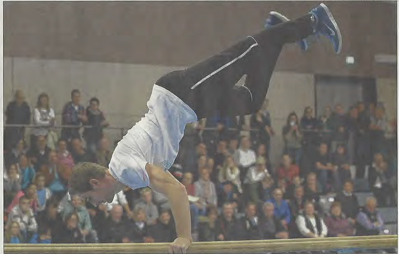
Calisthenics fördert Kraft, Beweglichkeit und Ausdauer. Die spektakulären Übungen wirken geschmeidig und erinnern doch ans olympische Ringeturnen. Das Publikum ist fasziniert.